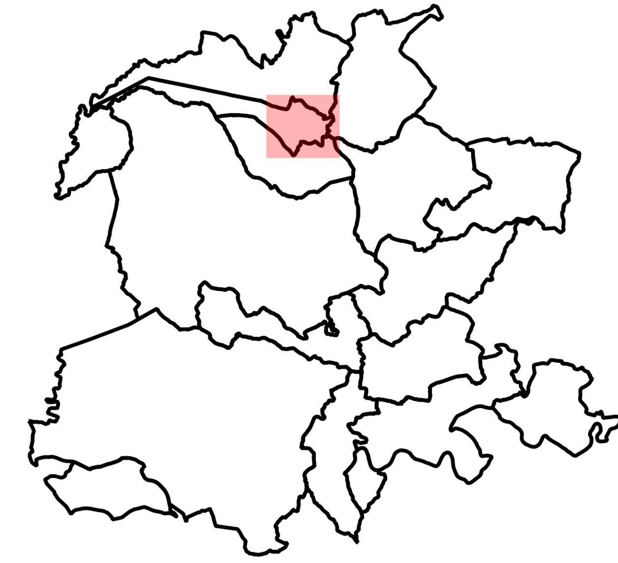
Planche de Loze Est