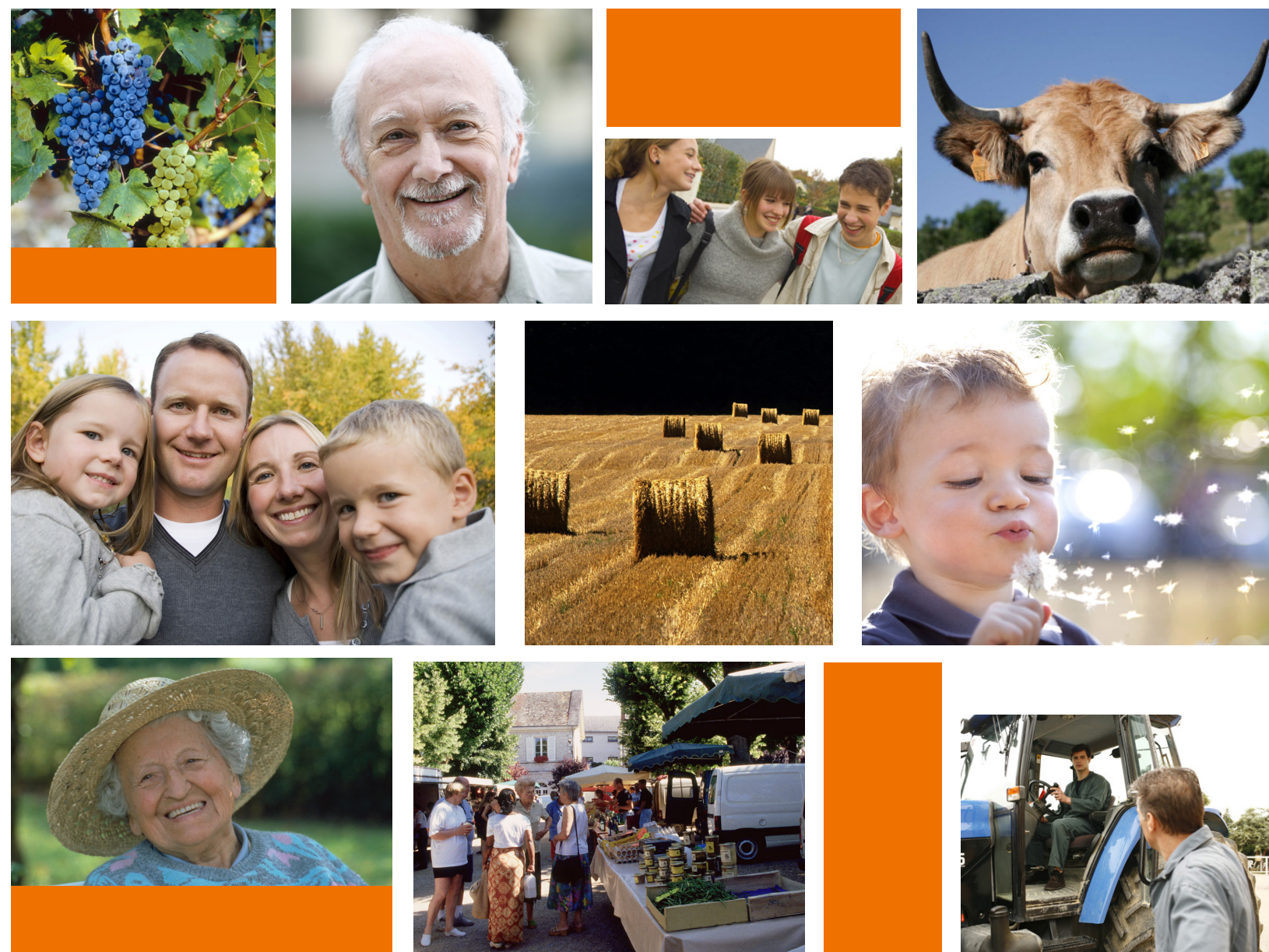
Réalisation Communication MSA MPN 2019 - MS/ASC