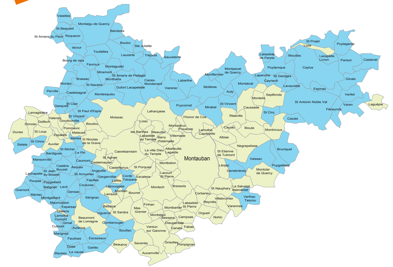
■ communes éligibles au dispositif SIL